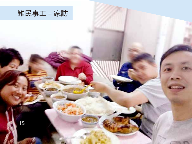
難民事工 - 家訪